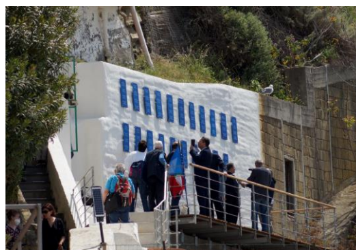
Inauguration du Mur des Migrants Mardi 3 mai 2022

Le Mur des Migrants, surplombant le port de la Corricella à Procida, rend hommage à ces hommes et à ces femmes, à leur courage et à leur détermination, pour se construire un nouveau destin en émigrant vers d'autres contrées. Leurs noms sont gravés sur des plaques et leurs histoires individuelles sont accessibles en ligne sur le Mur numérique.